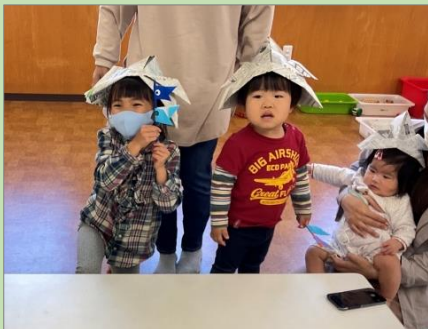
5月 こいのぼりとかぶと