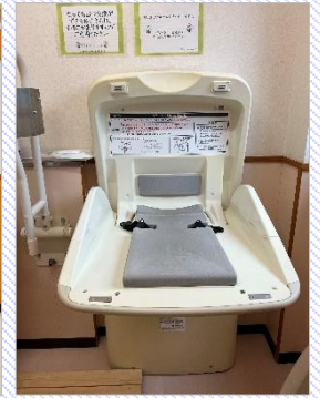
おむつ替えスペース