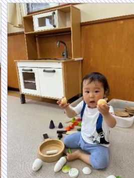
キッチン&ままごと