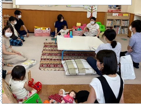
プレパパ・パパも一緒に参加できる