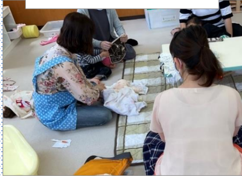
妊娠中の悩みごと相談できます