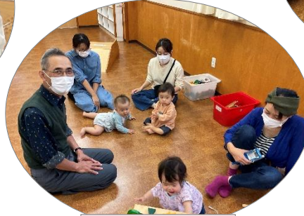
おじいちゃんと一緒に