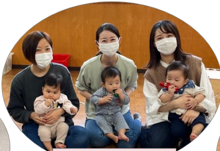
ひろばで仲間づくり