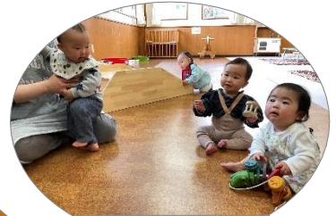
おもちゃで遊ぼう