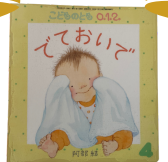
「でておいこ」 阿倍 結