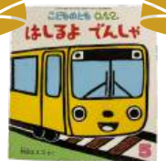
「はしるよ でんしゃ」 村田エミコ